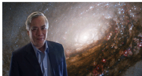
Trinh Xuan Thuan

Déléguée générale de Palestine auprès de la Belgique, Luxembourg et Union européenne