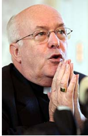
Godfried DANEELS, Archevêque de Malines-Bruxelles Cardinal