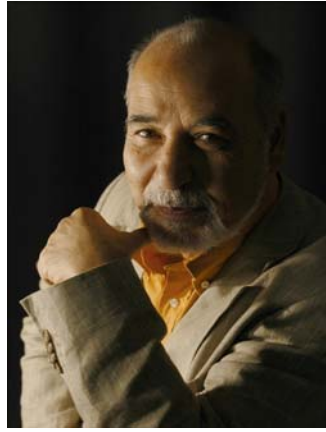
Tahar BEN JELLOUN Ecrivain