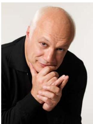
Eric-Emmanuel SCHMITT Ecrivain