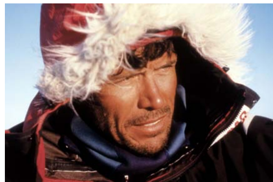
Alain HUBERT Explorateur

(dont les bio et bibliographies figureront sur notre site www.gclg.be )