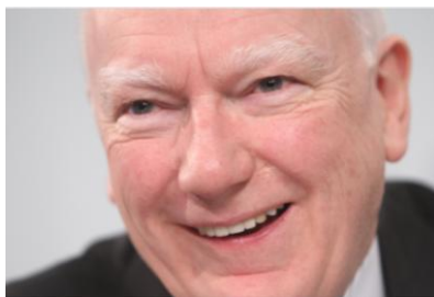
Philippe MAYSTADT Président de la BEI